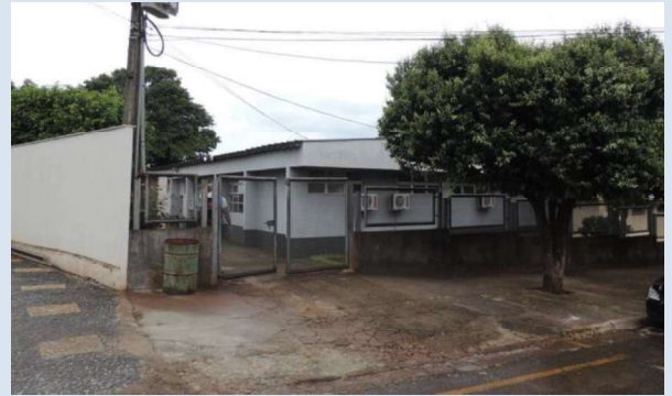
Registro de Localização.