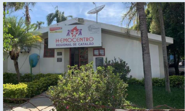
Registro de Localização.