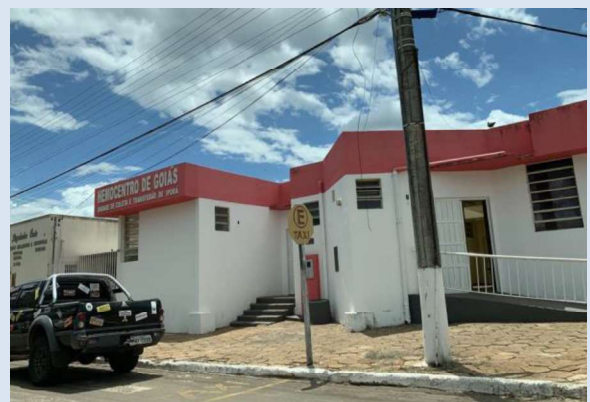
Registro de Localização.